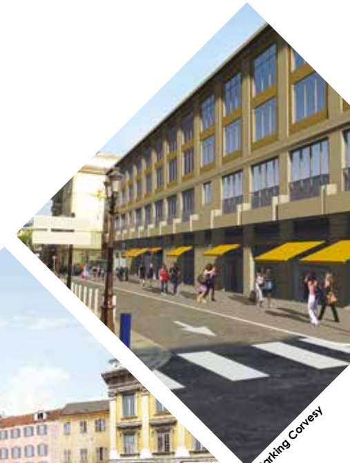
▶ Parking Corvesy