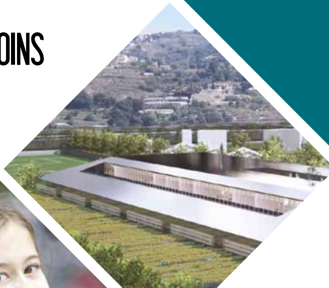
► Cuisine centrale