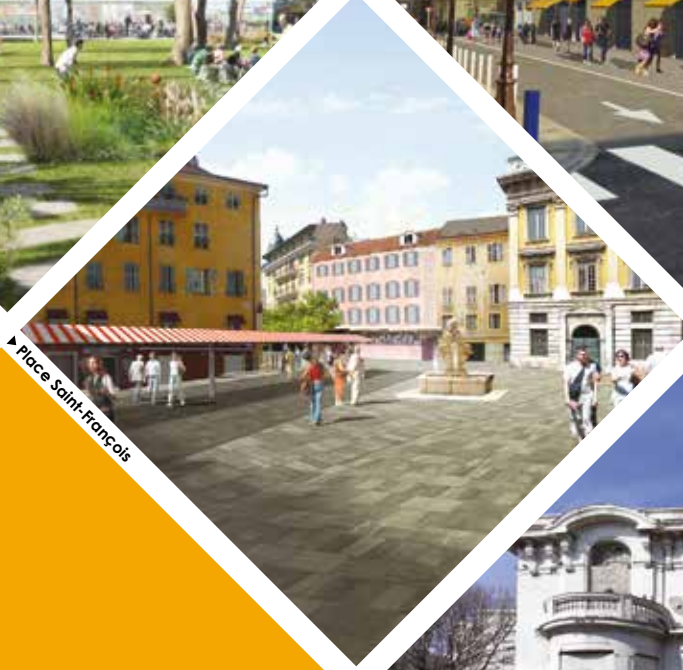
▶ Place Saint-François