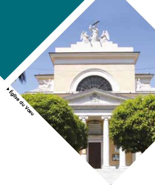
▶ Église du Vœu