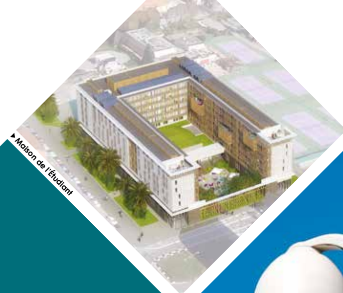
► Maison de l'étudiant