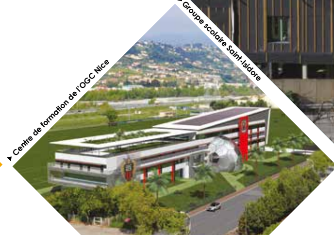
► Centre de formation de l'OGC Nice