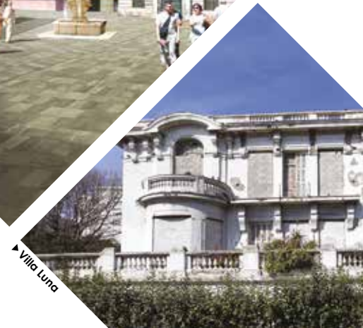
▶ Villa Luna