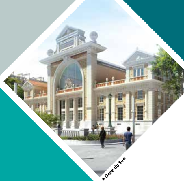
▶ Gare du Sud

D'autres projets niçois sont prévus en 2016 sur le budget de la Métropole Nice Côte d'Azur avec notamment la requalification de la zone piétonne Masséna.