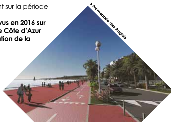
▶ Promenade des Anglais