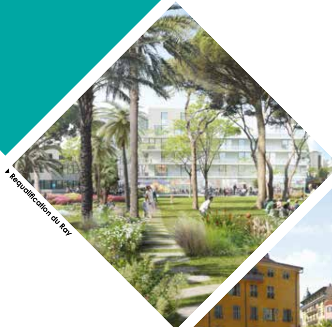
▶ Requalification du Ray